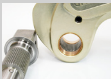
精密スプラインギア