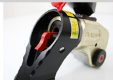
ワンタッチ反力受け