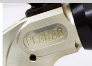
特許・高圧安全 2 重構造