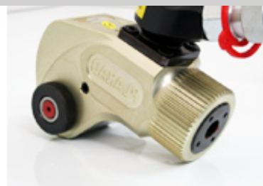
強靱軽量合金で高い剛性力