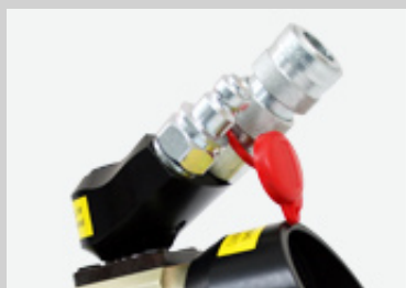
安全リリーフ弁とスイベル軸