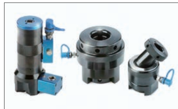
ボルトテンショナー

エア式：全11機種。140～12,000Nm。別置き型エアレギュレーターセット付き。