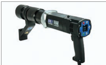
電動トルクレンチ ST