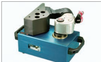
トルク検定・校正サービス