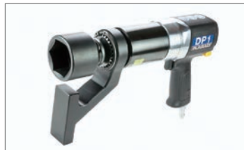
エアトルクレンチ STA

エア式：全11機種。140～12,000Nm。別置き型エアレギュレーターセット付き。